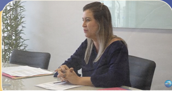
Instituto GAM seleciona projetos sociais de dez entidades da região