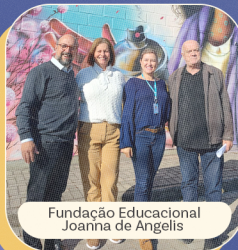
Fundação Educacional Joanna de Angelis

Este projeto teve como objetivo realizar visitas às OSCs de Tubarão para acompanhar e fortalecer seus trabalhos. Além disso, foram realizadas visitas às OSCs de referência em Criciúma e Florianópolis, com o intuito de conhecer seus projetos, programas e serviços. Confira alguns registros dessas visitas na sequência.