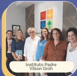
Instituto Padre Wilson Groh