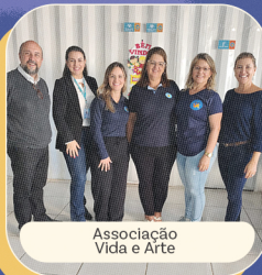
Associação Vida e Arte